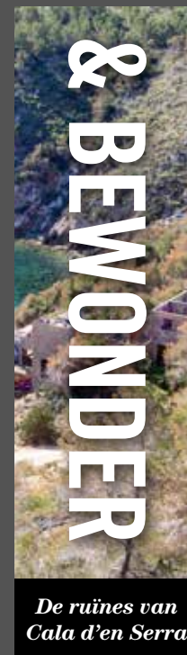
De ruïnes van Cala d'en Serra