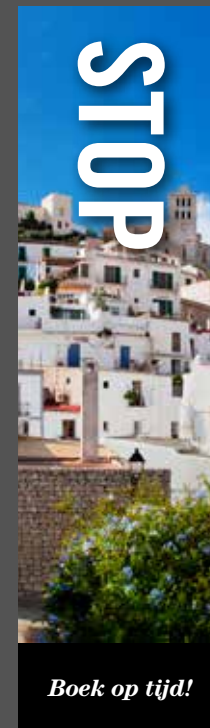
Boek op tijd!